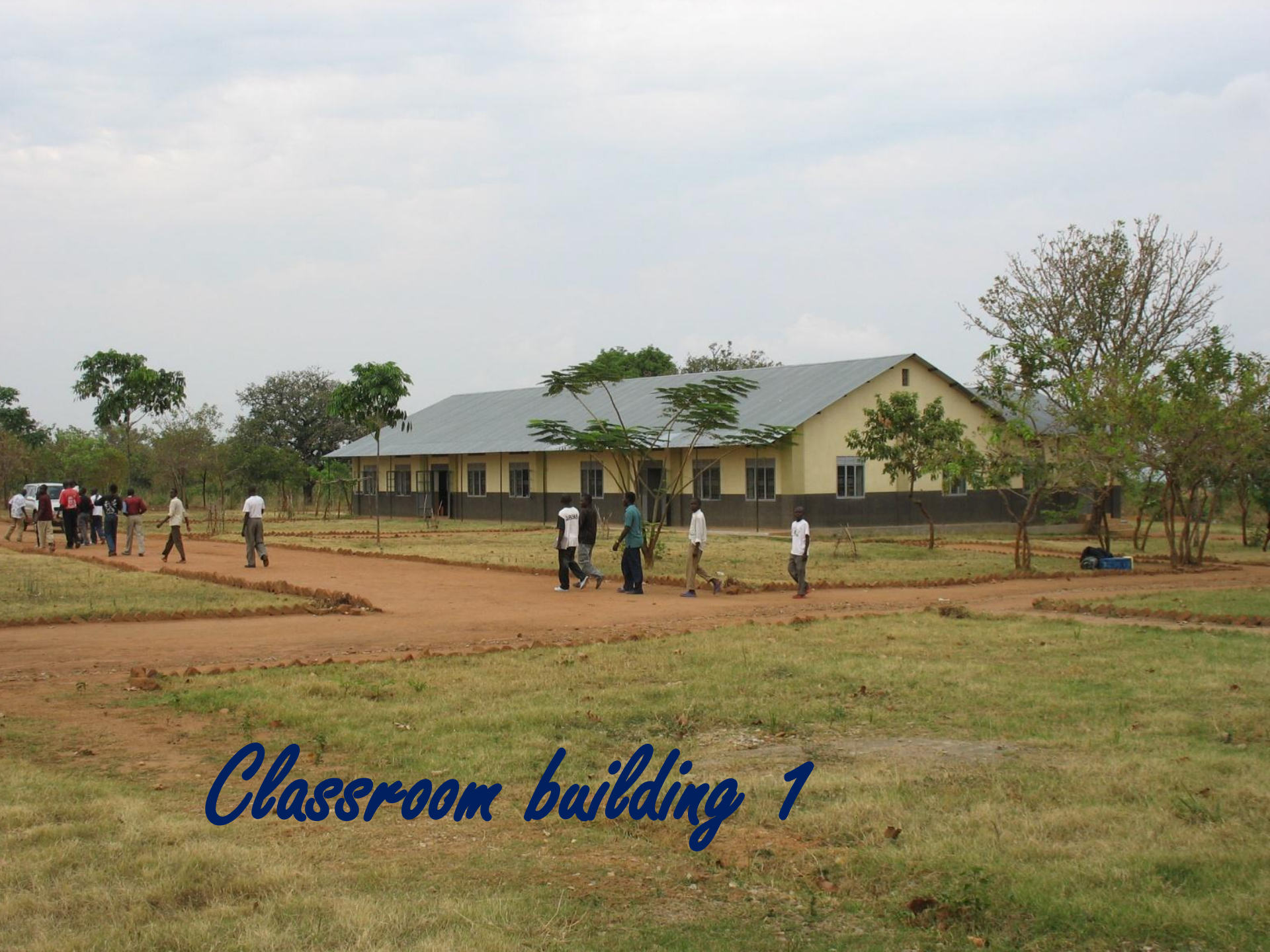
Classroom building 1